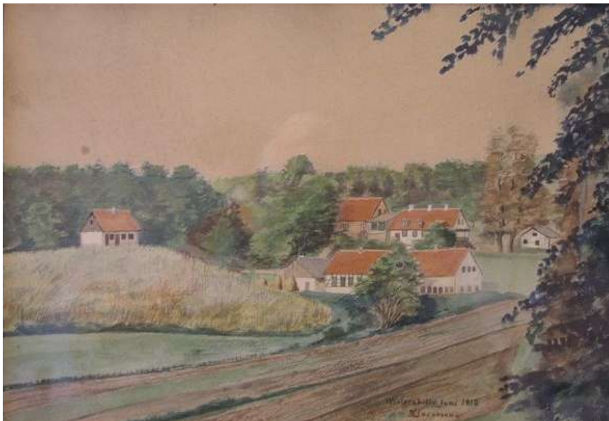
Billedet er fra juni 1912.

Hvis der ikke var regn i vente, skulle lærredet stænkes.